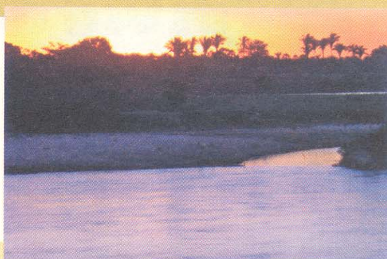
Quattro suggestive immagini del paesaggio brasiliano