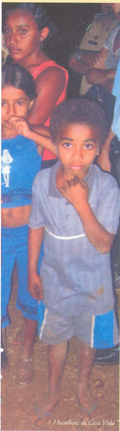
I bambini di Casa Vida