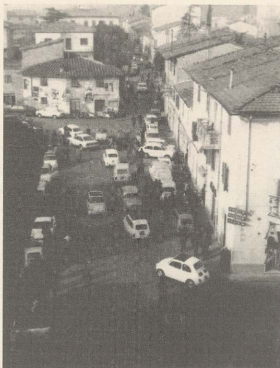
L'ingresso da via Montalbano in Piazza Risorgimento in una immagine degli anni '60.