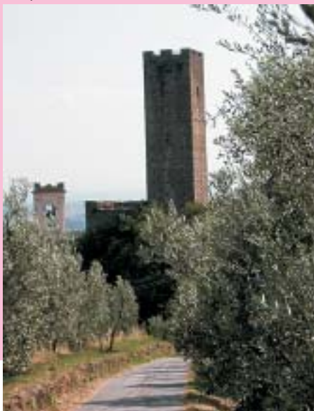
Il castello di Larciano

Da quel momento però l'importanza del castello iniziò a diminuire, sia perchè i confini da difendere si erano spostati, sia perchè le nuove tecniche di guerra basate sulla polvere da