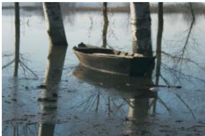
Nel cuore del Padule

Il Porto de Le Morette, che le carte del 1800 ci mostrano molto diverso dall'attuale, a differenza degli altri scali del Padule era una piccola darsena con gli argini sostenuti da muri di pietra, a testimonianza del notevole valore di questo approdo lungo le vie di navigazione. Nelle carte storiche del 1700 è già citato un "Porto delle Morette", identificabile nell'attuale omonimo porto, che fu costruito probabilmente per la perdita di agibilità di un Porto vecchio delle Morette situato più a nord.