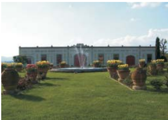
Villa La Morgia