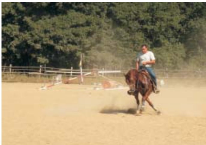
Esercitazioni in un maneggio sul Montalbano

Si prosegue lungo lo sterrato, ora in discesa più impegnativa, fino ad un ampio piazzale (9,2 km dalla partenza) con al centro un maestoso leccio dal quale partono cinque strade. Alcuni cartelli all'imbocco del piazzale ci danno la direzione: dobbiamo seguire lo sterrato in discesa che punta decisamente a sud (il secondo alla nostra dx, direzione Capraia).