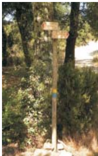
Bivio sopra Capraia

A 12,3 km finisce la boscaglia e ci troviamo nuovamente immersi in uliveti e vigneti. Poco più avanti, in corrispondenza di un residence con campi da tennis, inizia l'asfalto.