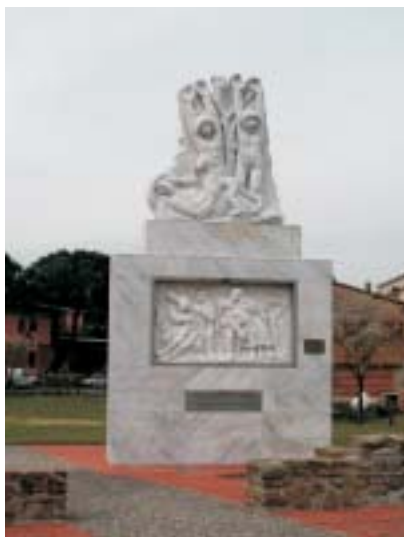
Monumento in ricordo dell'eccidio nel Padule

In breve si raggiunge il posteggio con area attrezzata del Centro Visite dove ci si può rivolgere per le visite guidate.