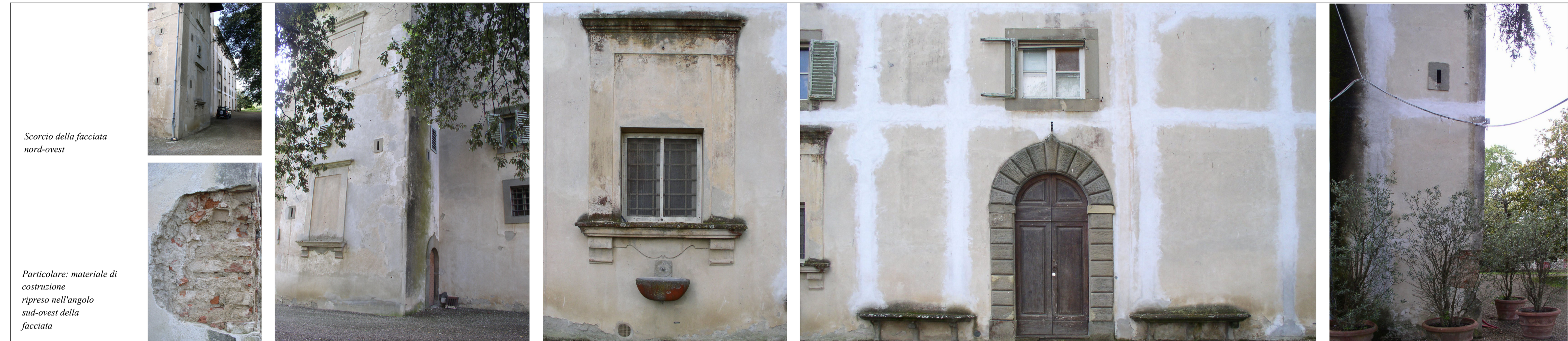
Scorcio della facciata nord-ovest