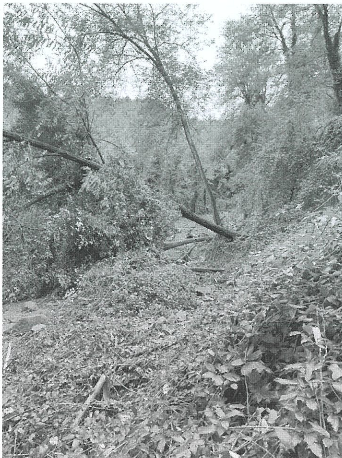
Fotografia n. 2 – Frana via Sambusceta