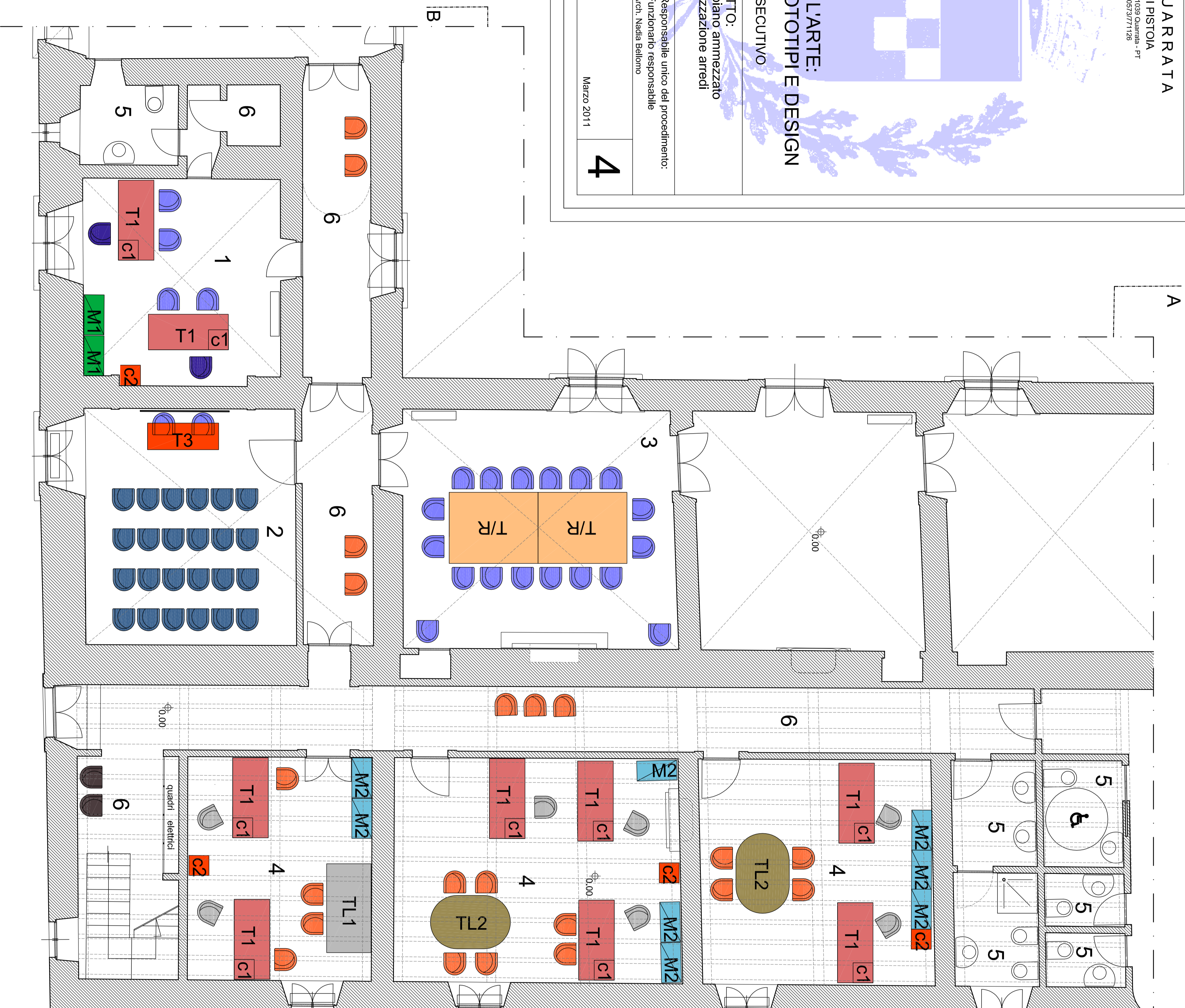
PIANTA PIANO TERRA scala 1:50