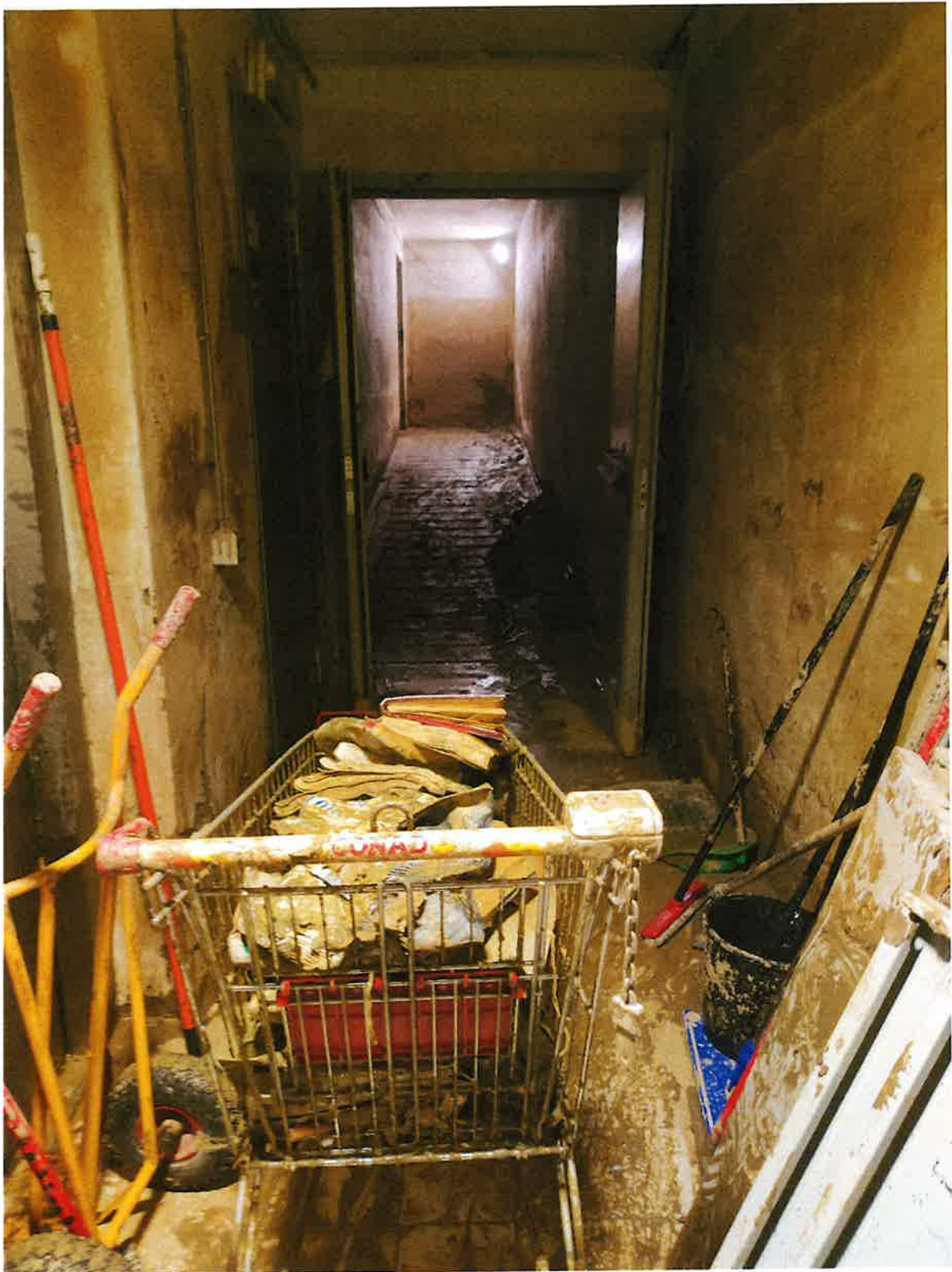
Fig. 8: dettagli corridoio lato sud. Mattina 15/11/2023