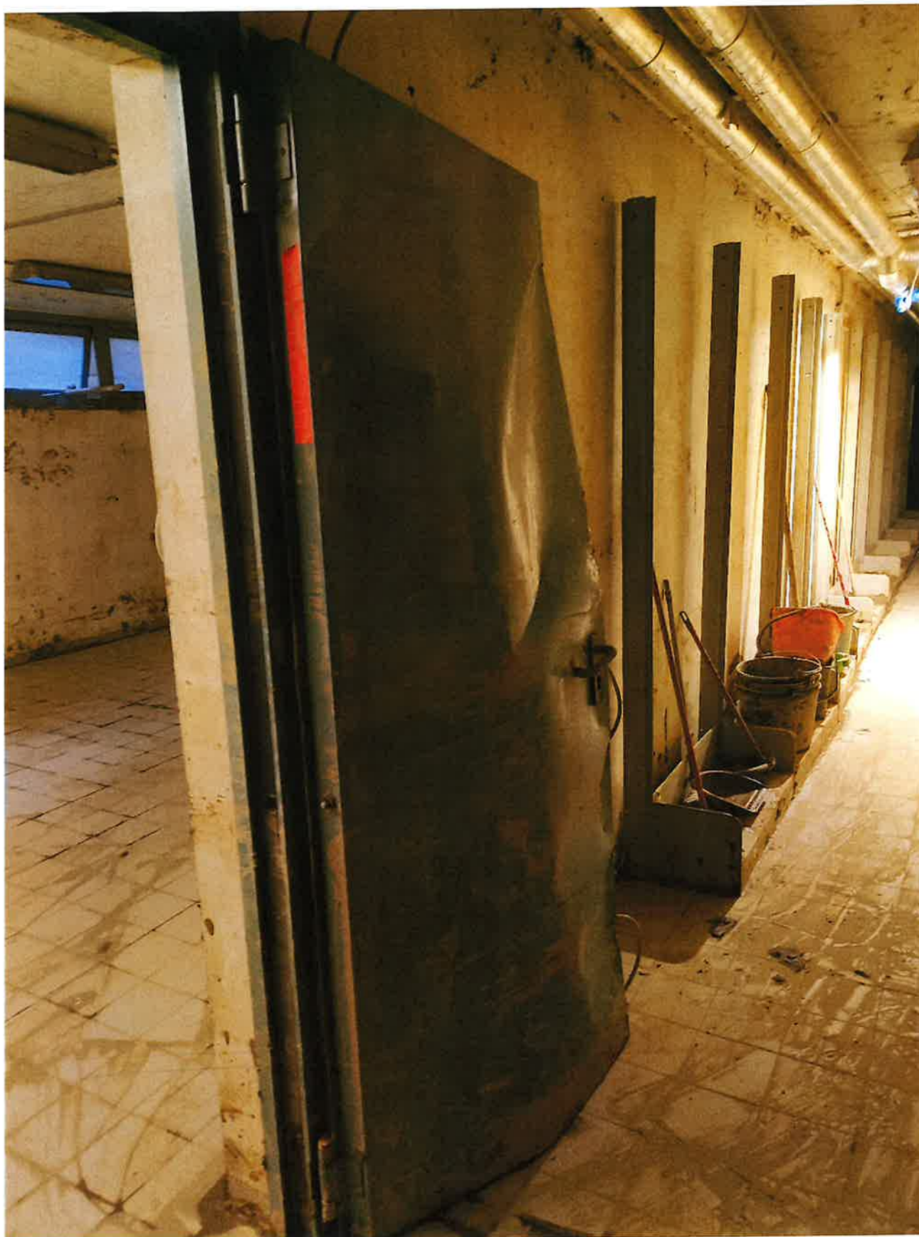
Fig. 9: dettaglio porta stanza 2. Mattina 15/11/2023