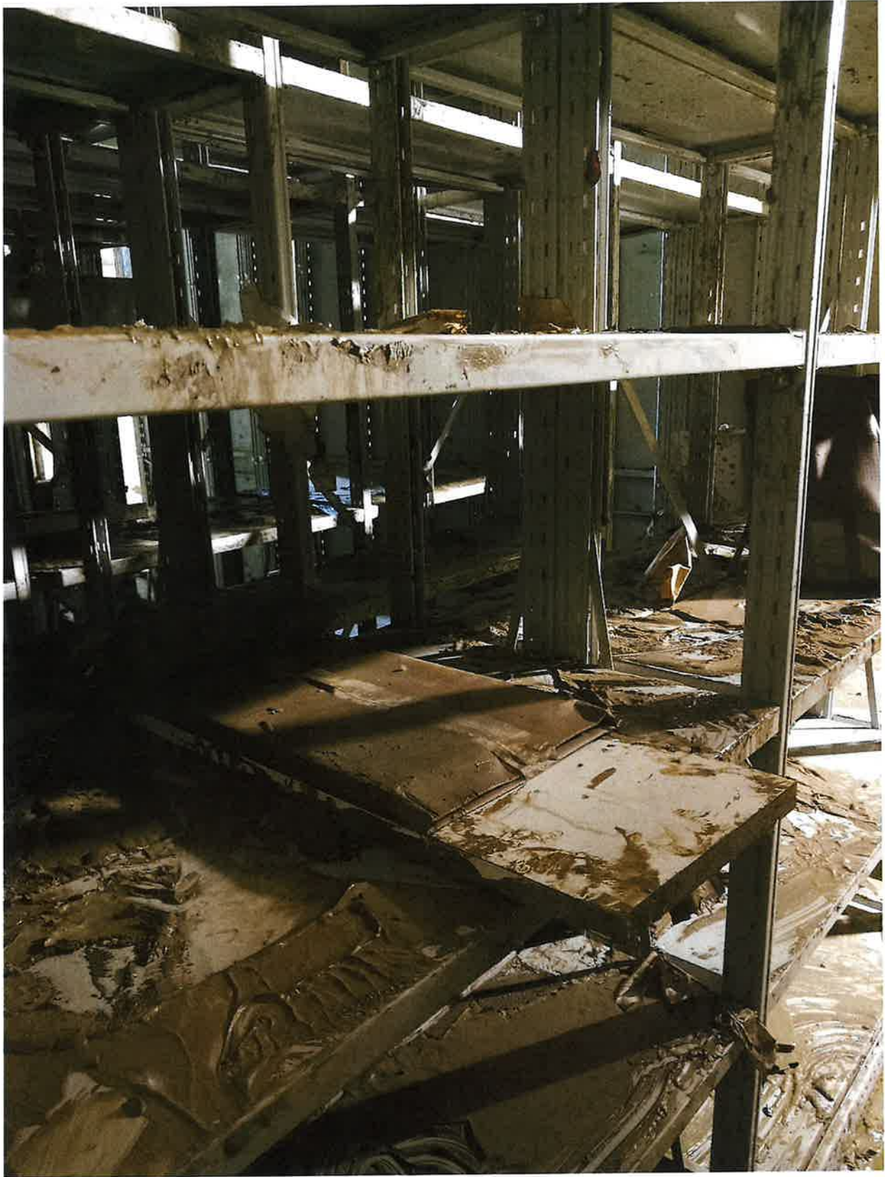
Fig. 2: dettaglio scaffale Archivio Storico. Mattina 15/11/2023