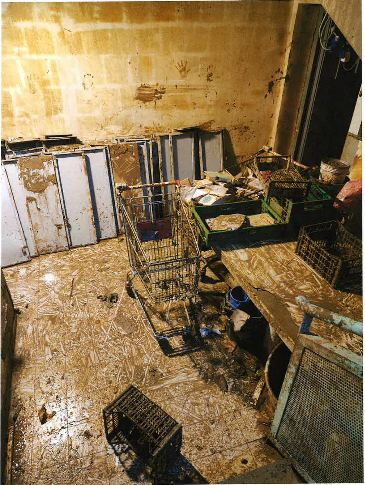
Fig. 6: dettagli sgombero. Mattina 15/11/2023