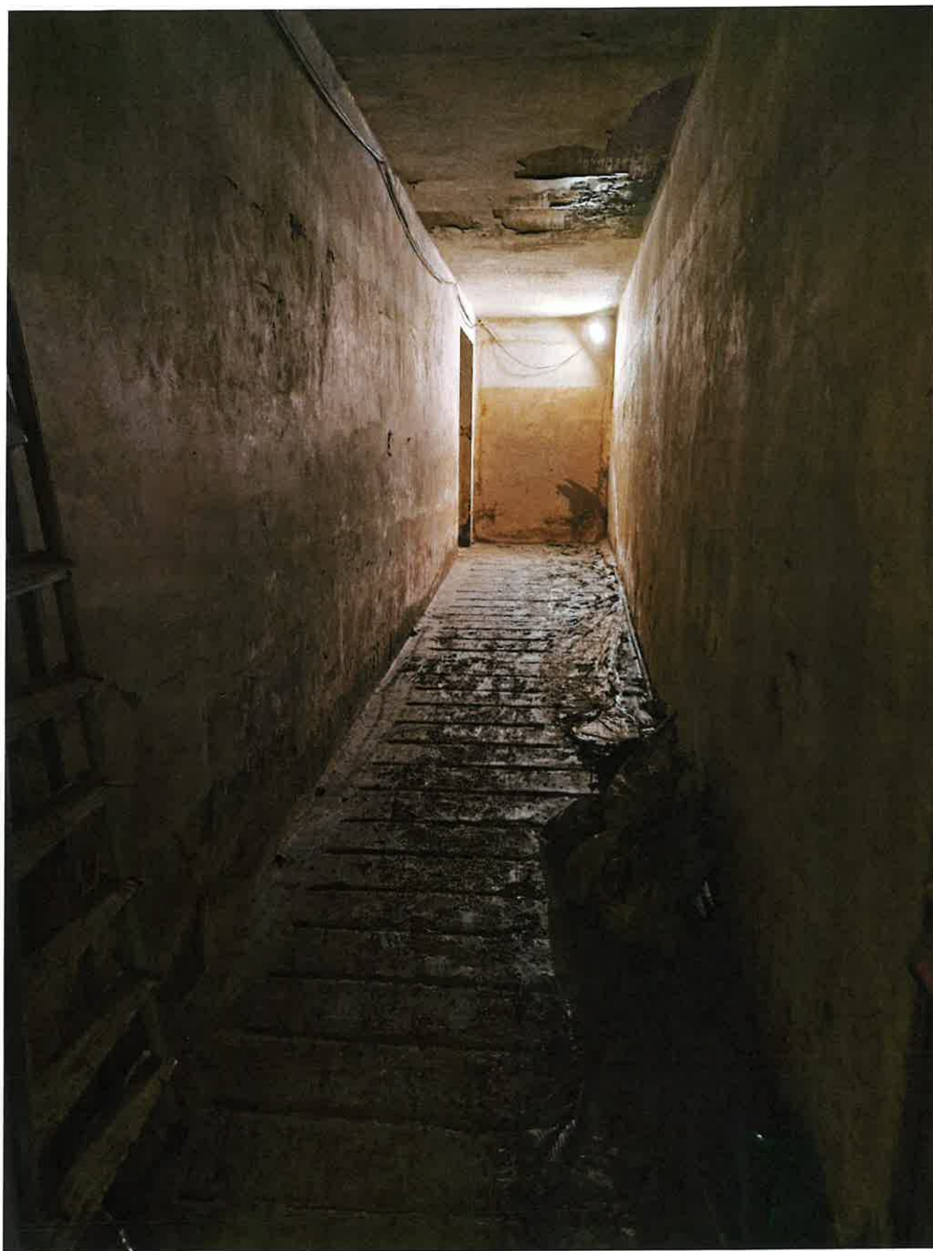
Fig. 13: dettaglio corridoio lato sud. Pomeriggio 16/11/2023