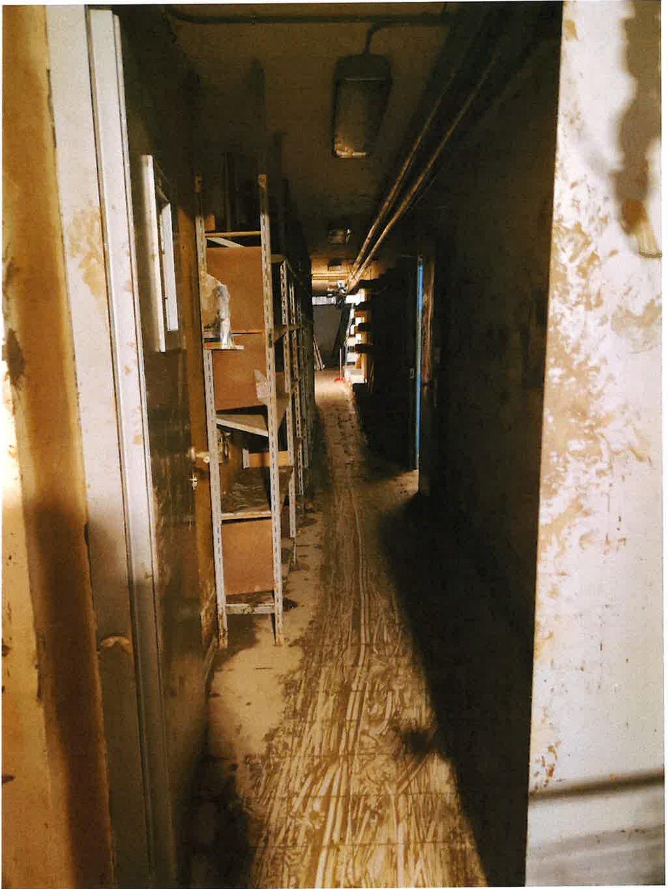
Fig. 7: dettagli sgombero. Corridoio magazzino. Mattina 15/11/2023