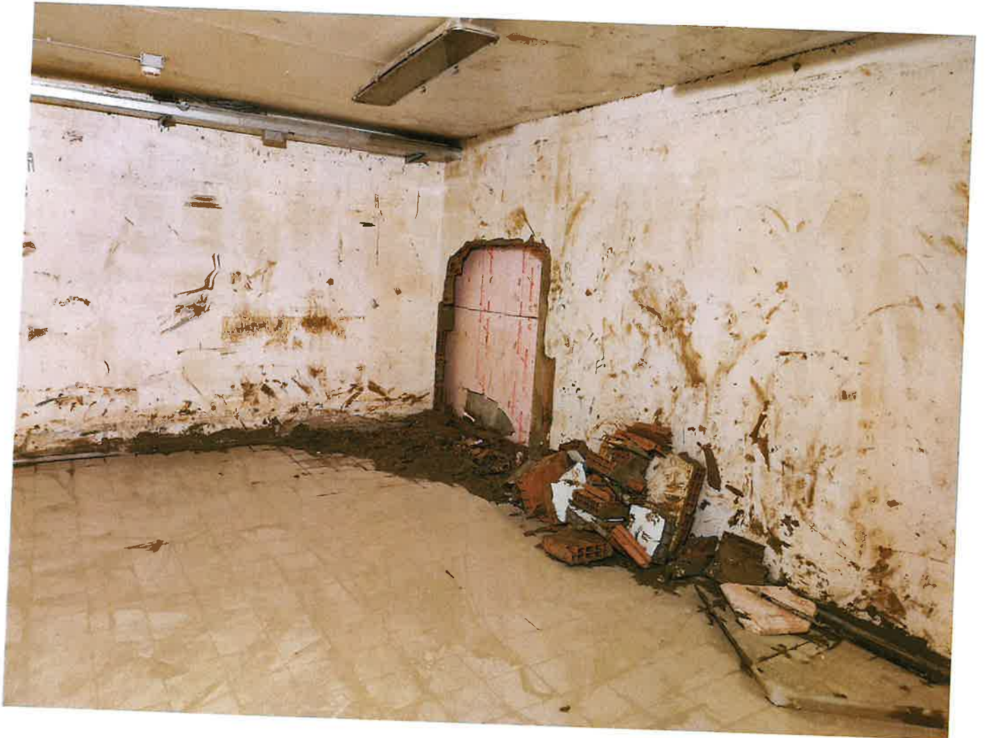
Fig. 12: dettaglio muro stanza 2. Pomeriggio 16/11/2023