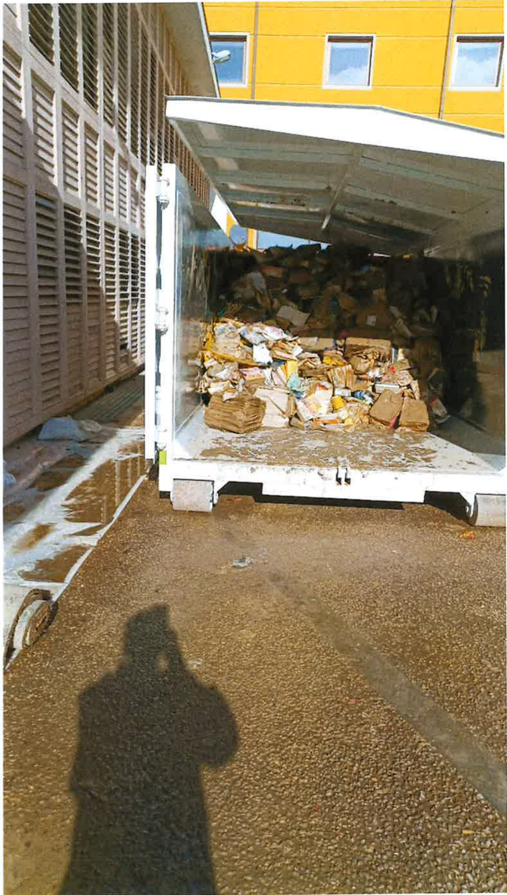
Fig. 5: scarrabile nel piazzale della Biblioteca. Pomeriggio 15/11/2023