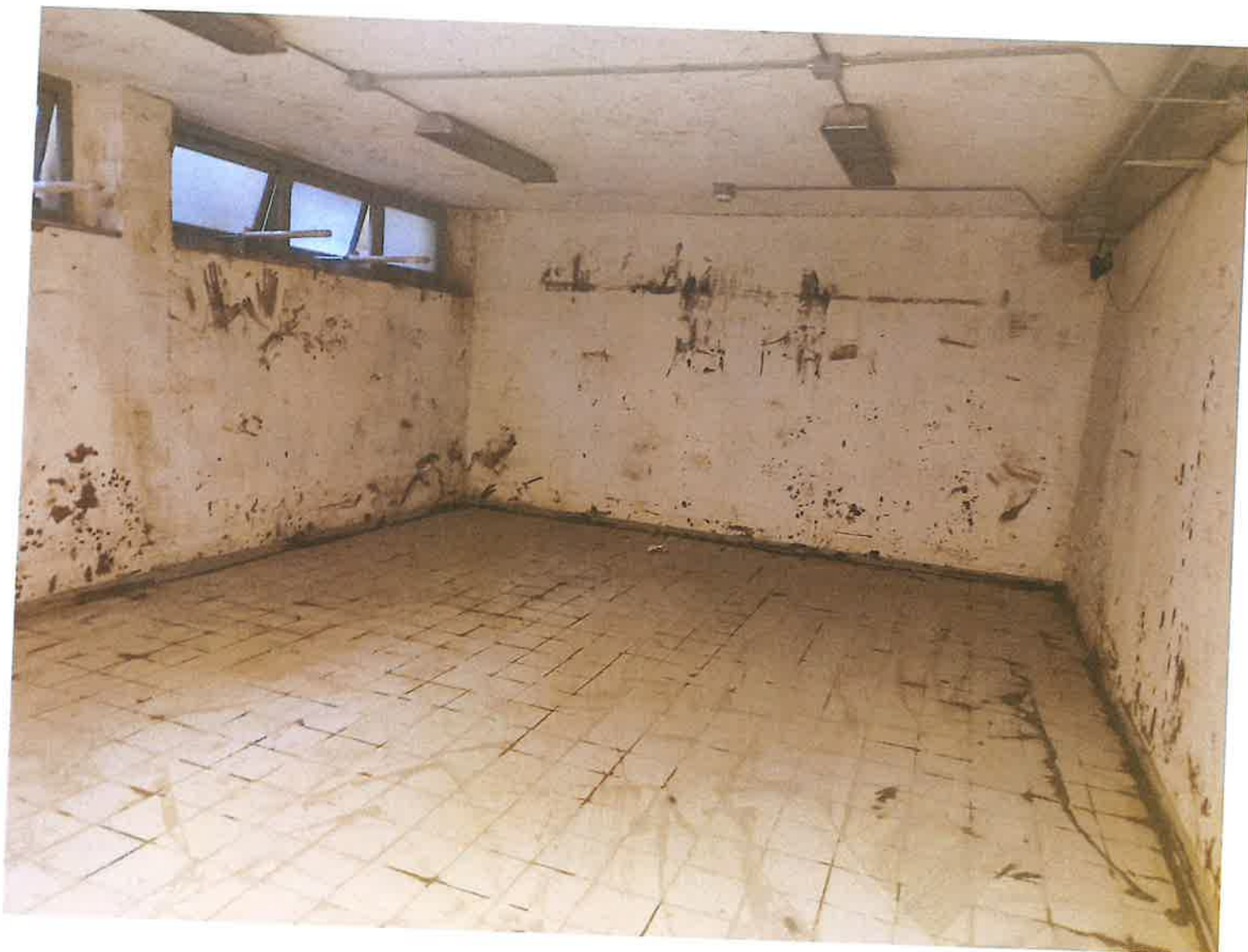
Fig. 11: stanza 2. Pomeriggio 16/11/2023