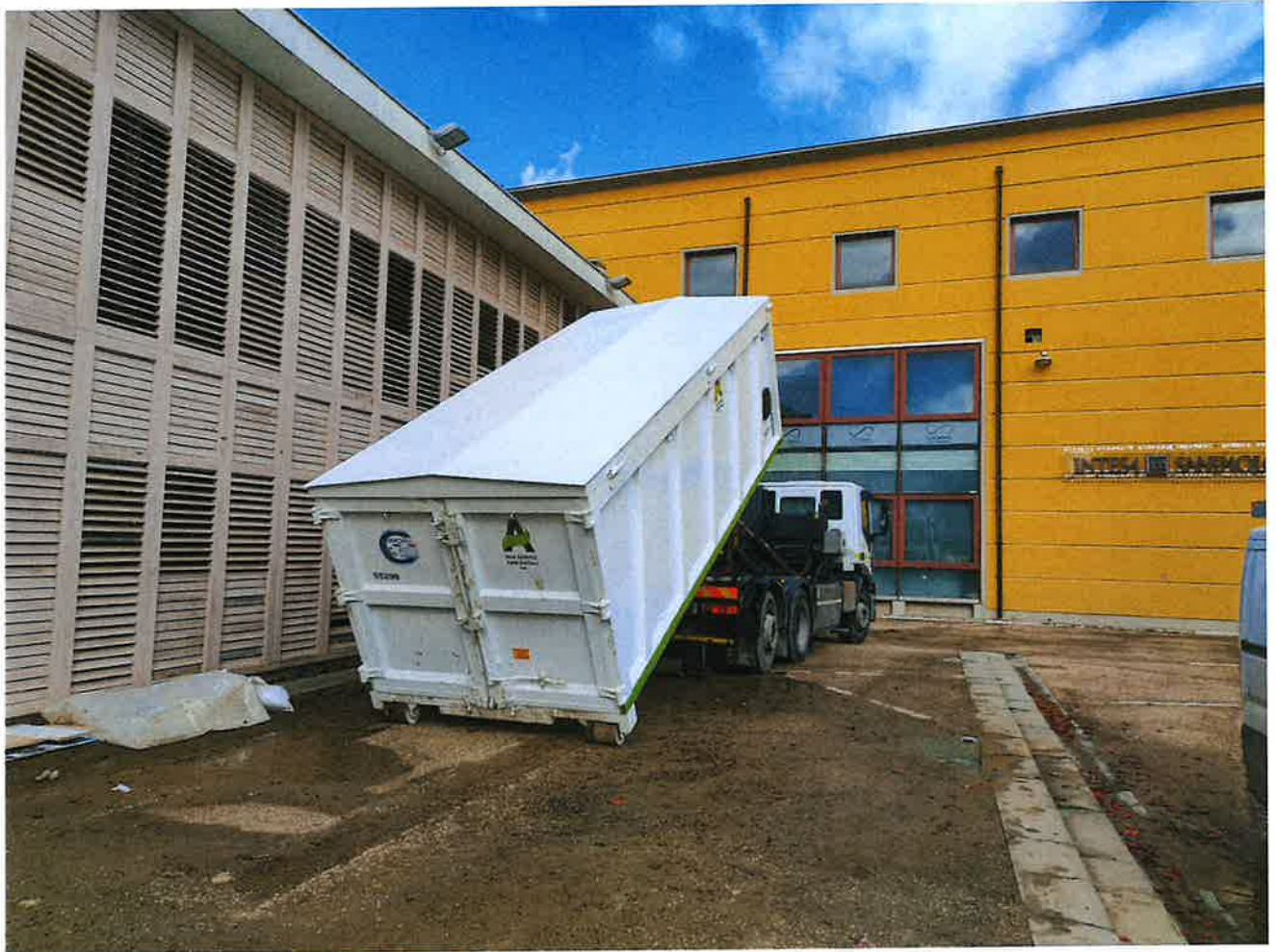
Fig. 4: scarrabile mezzogiorno 15/11/2023