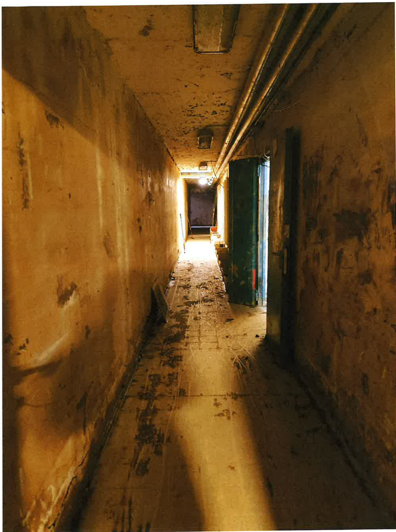
Fig. 14: corridoio magazzino pomeriggio 16/11/2023