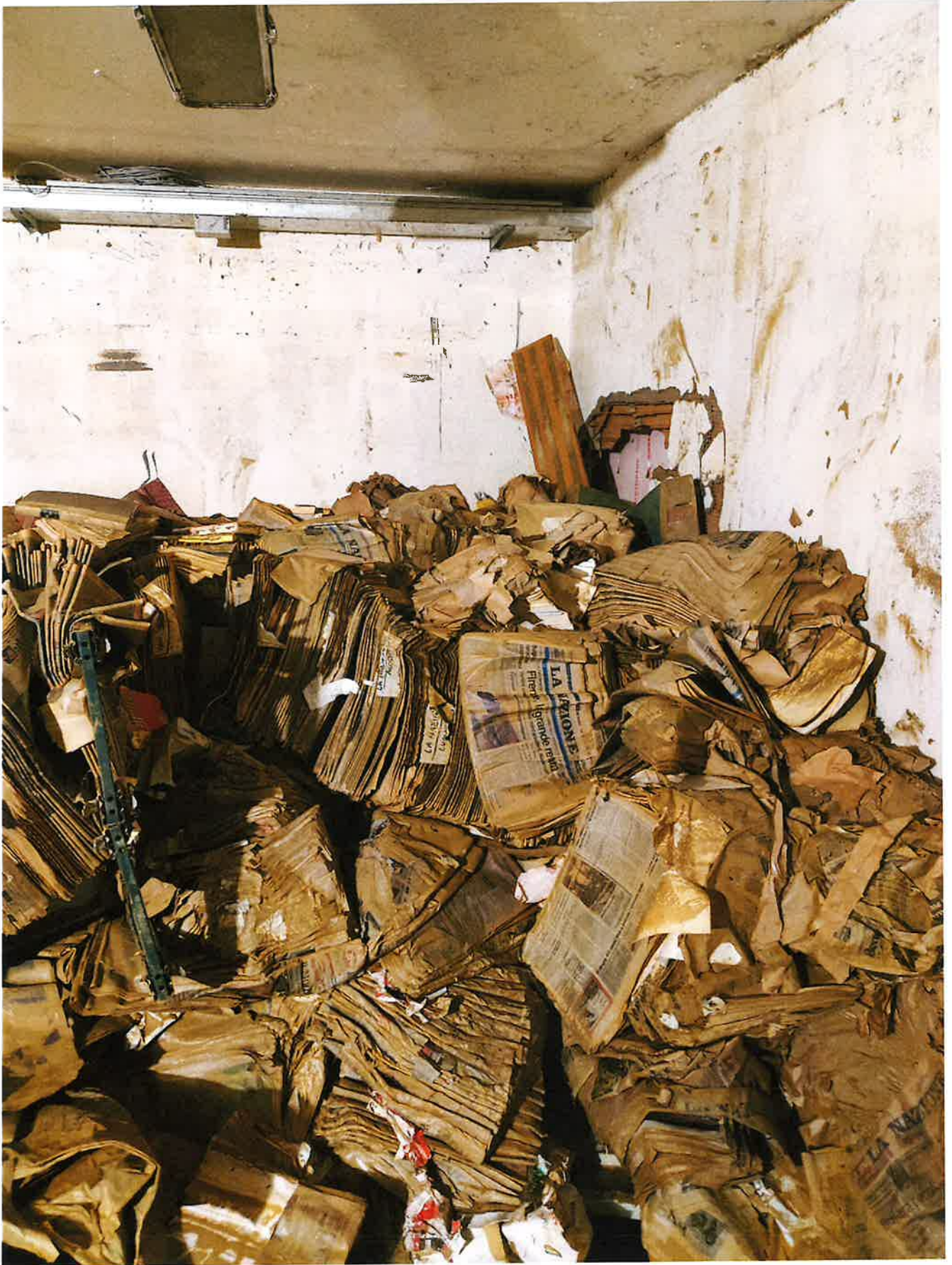
Fig. 3: dettaglio muro stanza 2. Mattina 15/11/2023