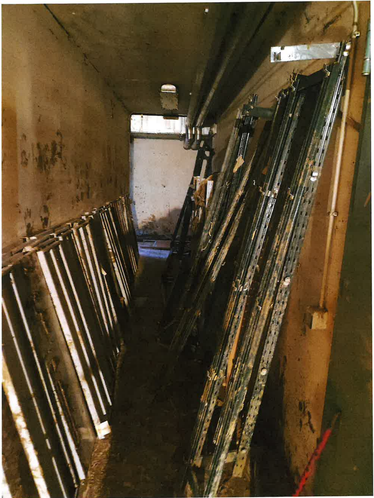
Fig. 1: dettaglio corridoio, mattina 15/11/23