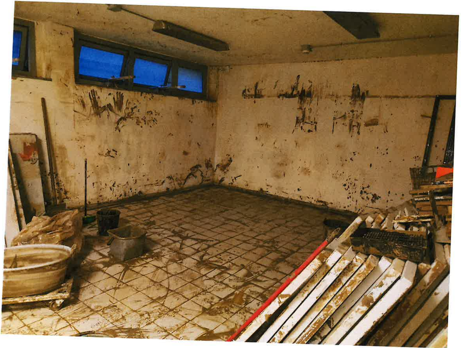
Fig. 10: stanza 2. Sera 15/11/2023