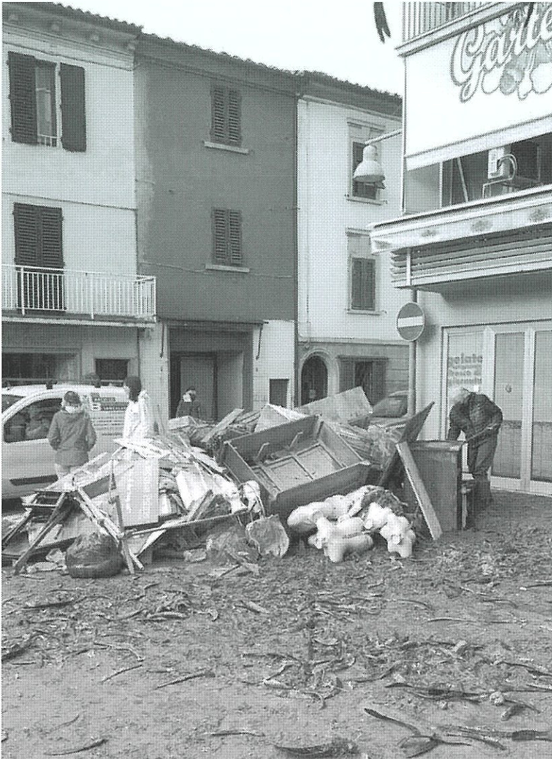
Fotografia n. 2 – Angolo piazza Risorgimento