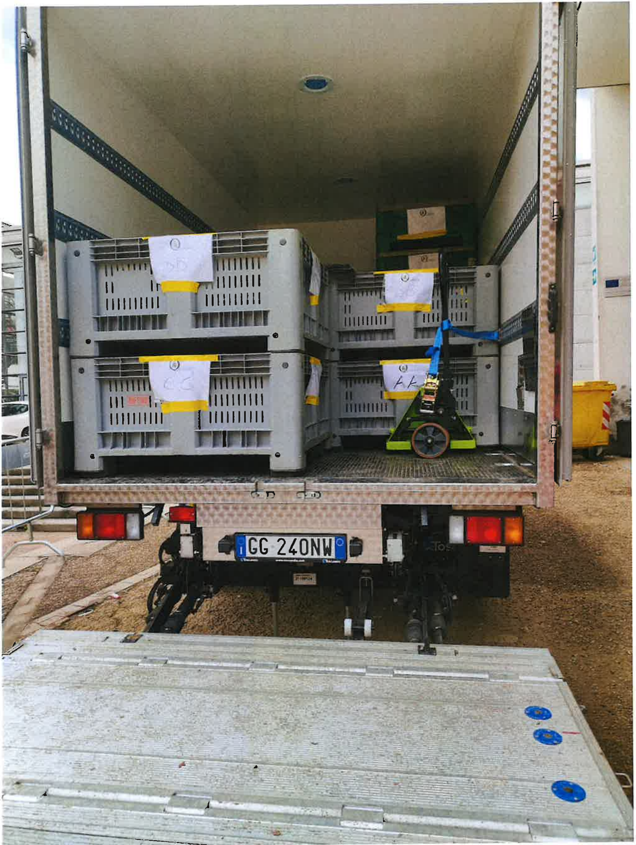
Fig. 17: dettagli bin sul camion. Pomeriggio 9/11/2023