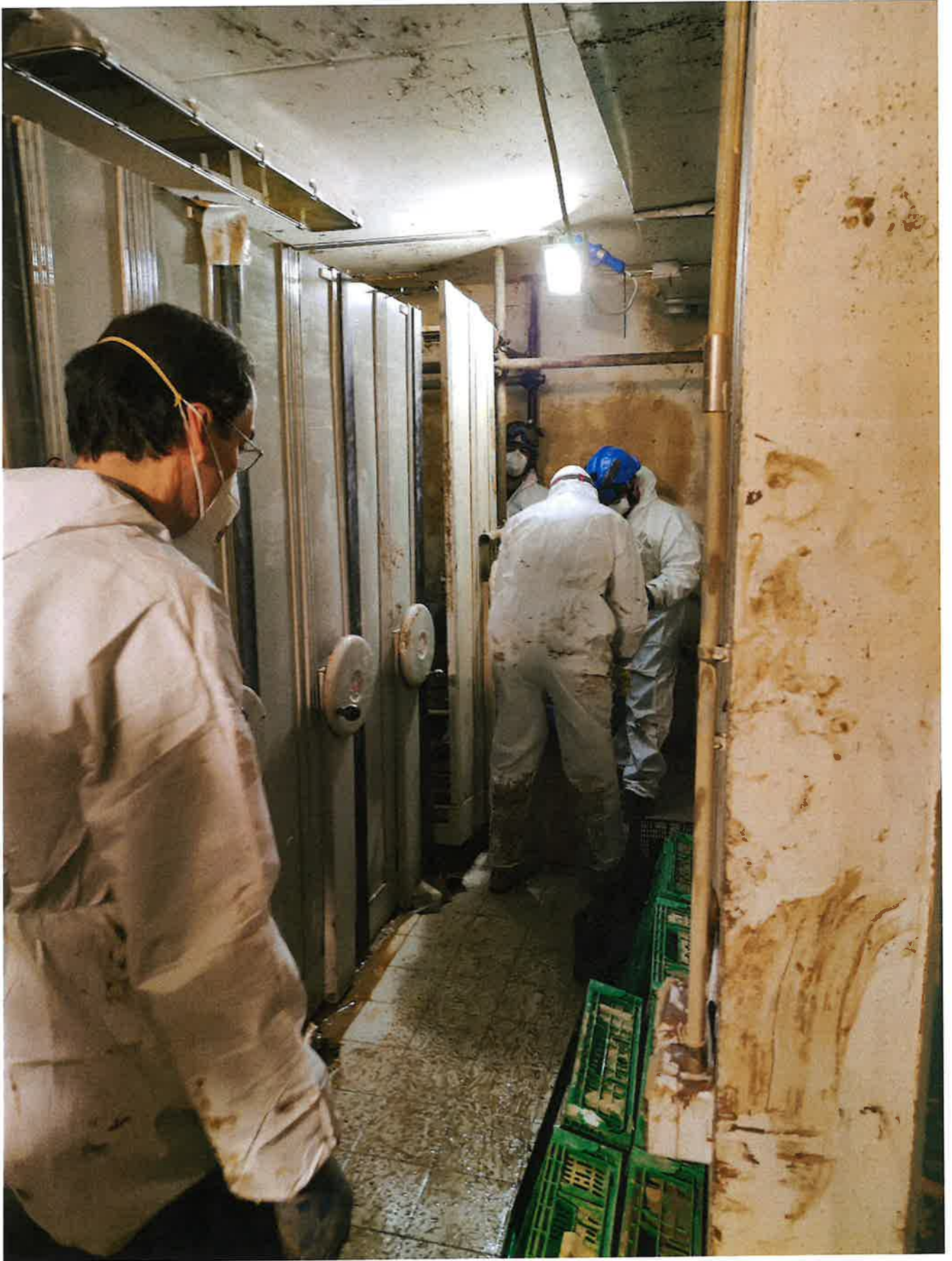
Fig. 3: Archivio Storico, squadra Carabinieri in azione. 8/11/2023