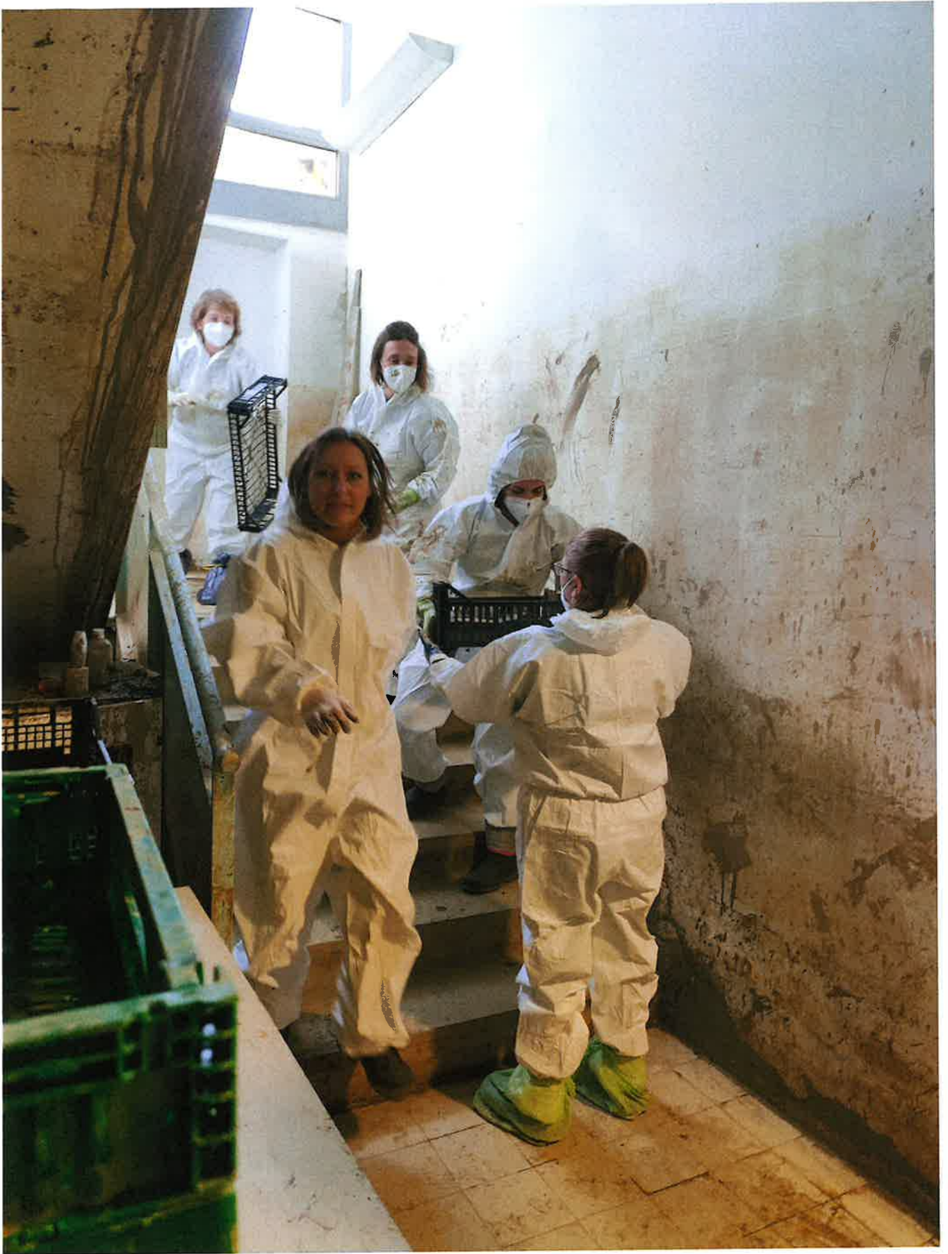
Fig. 6: dettaglio passaggio dei documenti. 8/11/2023