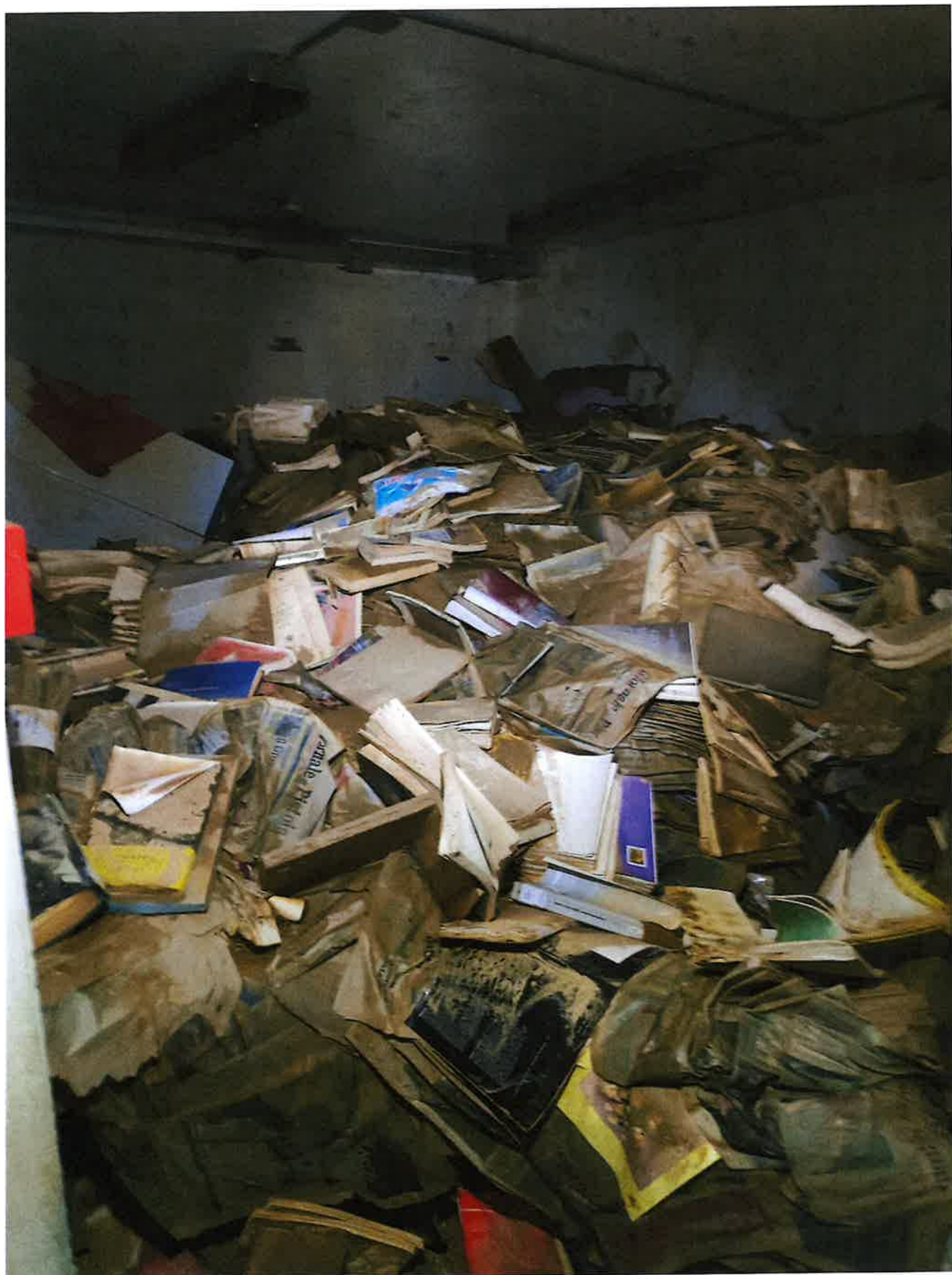
Fig. 14: dettaglio stanza 2 magazzino, mezzogiorno 9/11/23