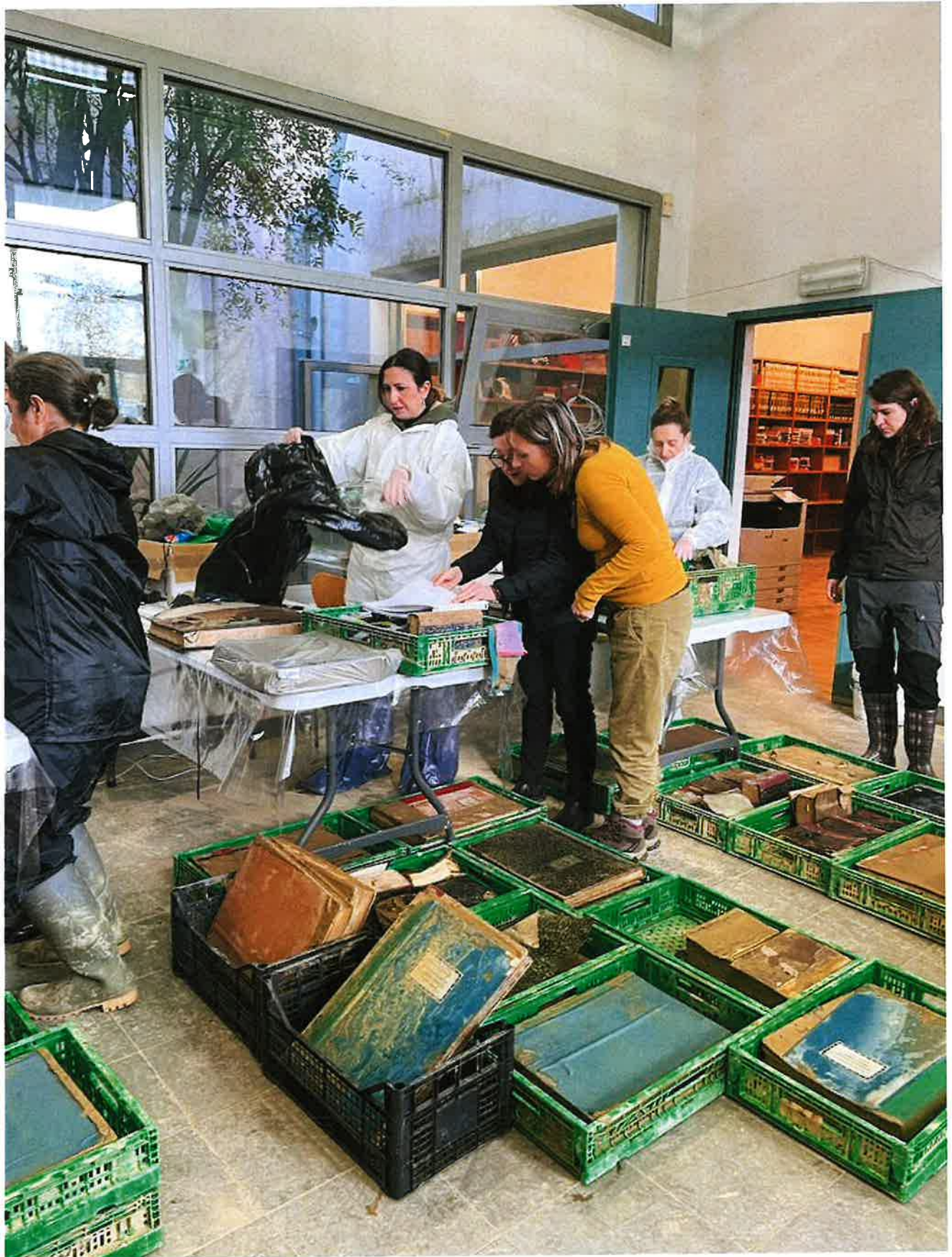
Fig. 12: Soprintendenza al lavoro. 9/11/2023