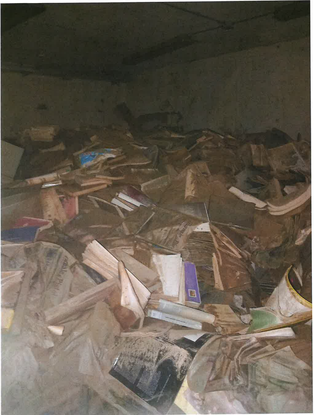
Fig. 13: dettagli stanza 2 magazzino, mezzogiorno 9/11/2023