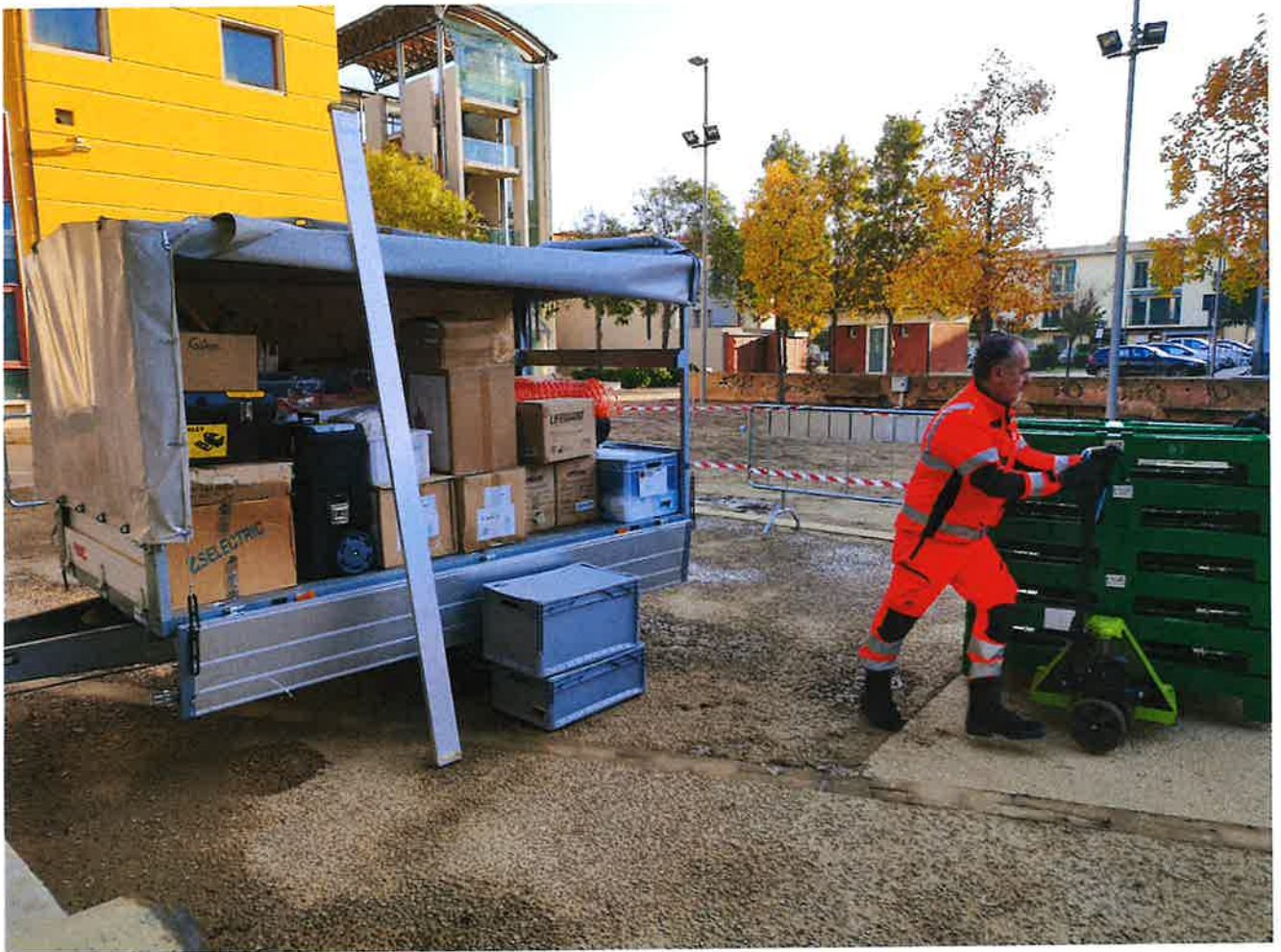
Fig. 1: preparazione esterna mattina 8/11/2023