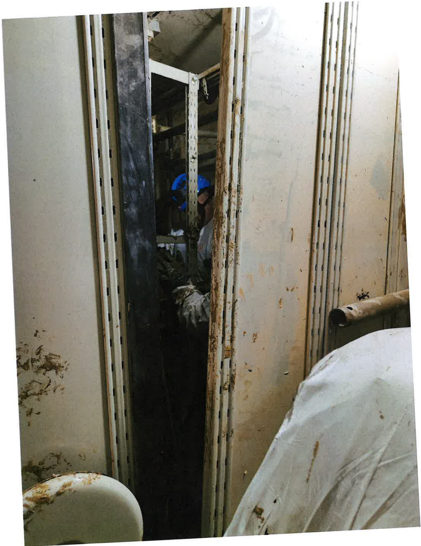
Fig. 4: Archivio Storico, squadra Carabinieri in azione. 8/11/2023