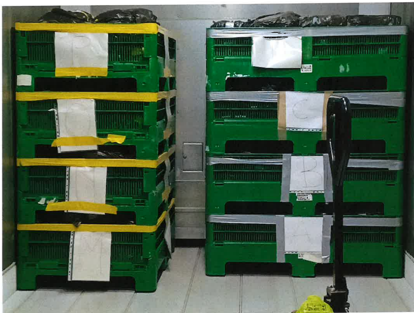
Fig. 7: celle frigo presso la Chiesa di Calenzano con i documenti dell'Archivio Storico. 8/11/23