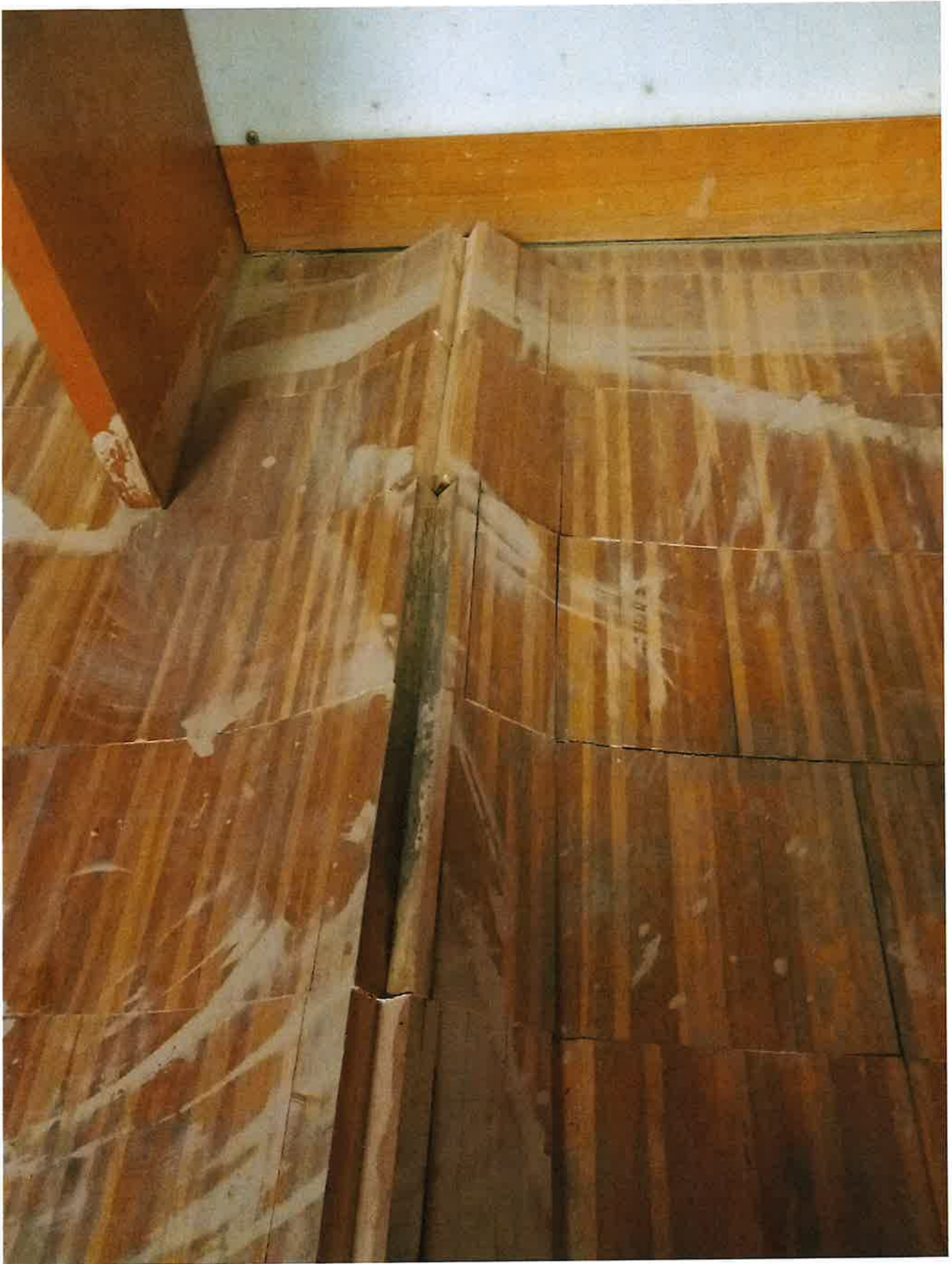
Fig. 16: dettagli parquet salone. Pomeriggio 9/11/2023