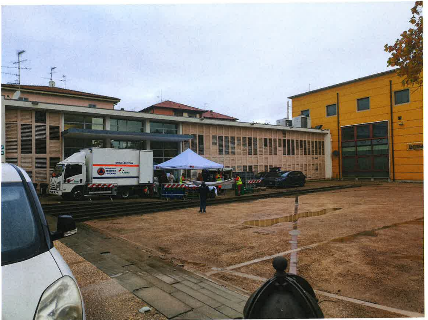
Fig. 8: Biblioteca mattina 9/11/2023