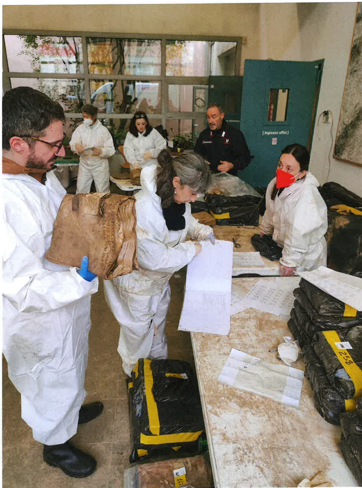
Fig. 11: Soprintendenza al lavoro. 9/11/2023