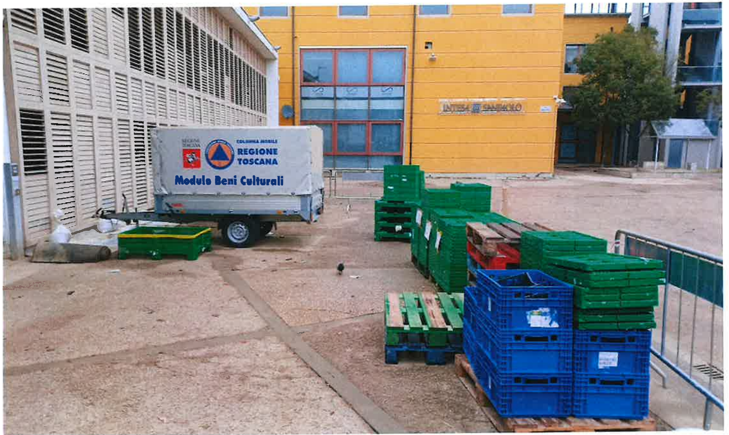
Fig. 9: Biblioteca mattina 9/11/2023