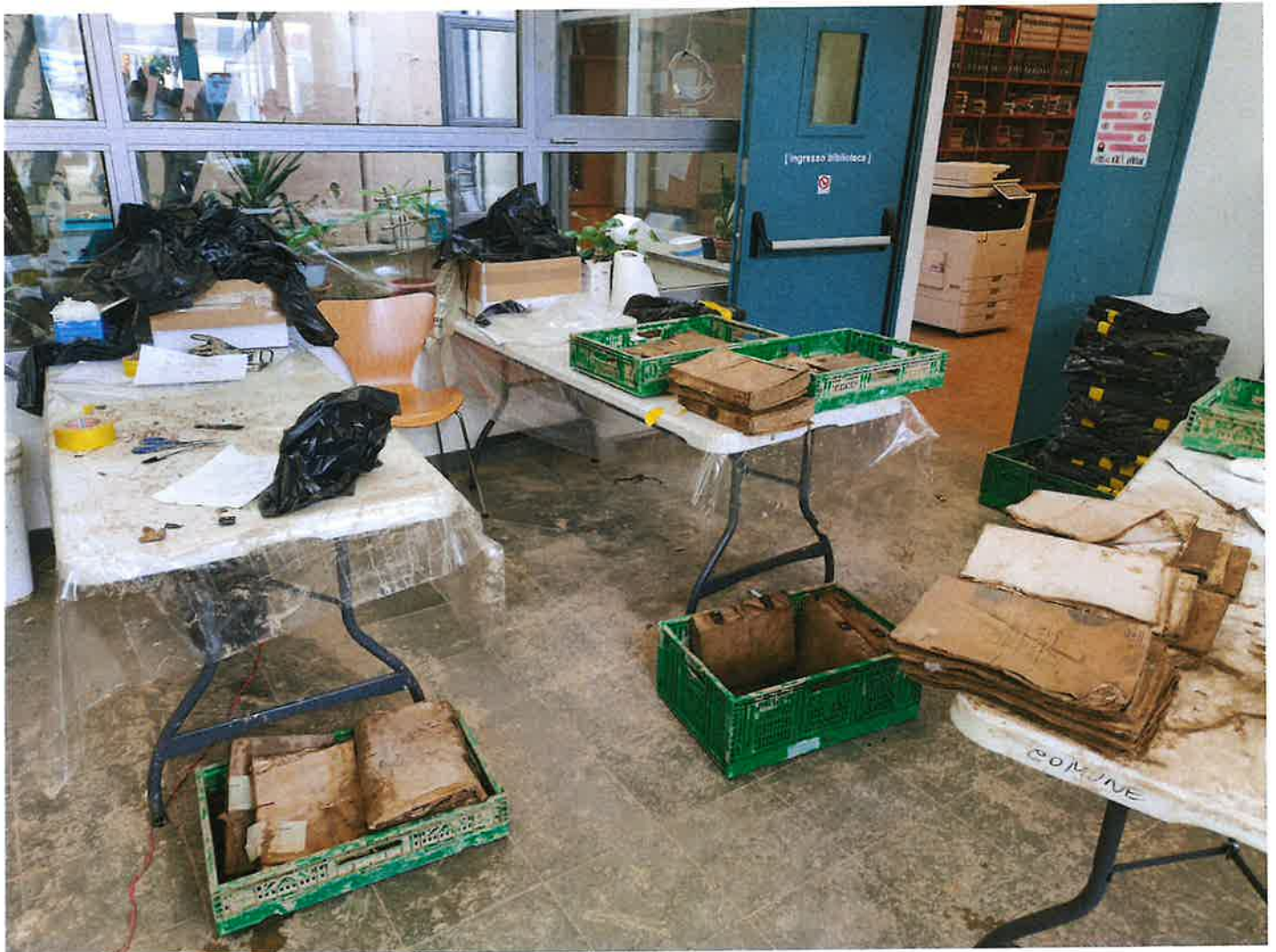
Fig. 15: dettagli del lavoro. Pomeriggio 9/11/2023