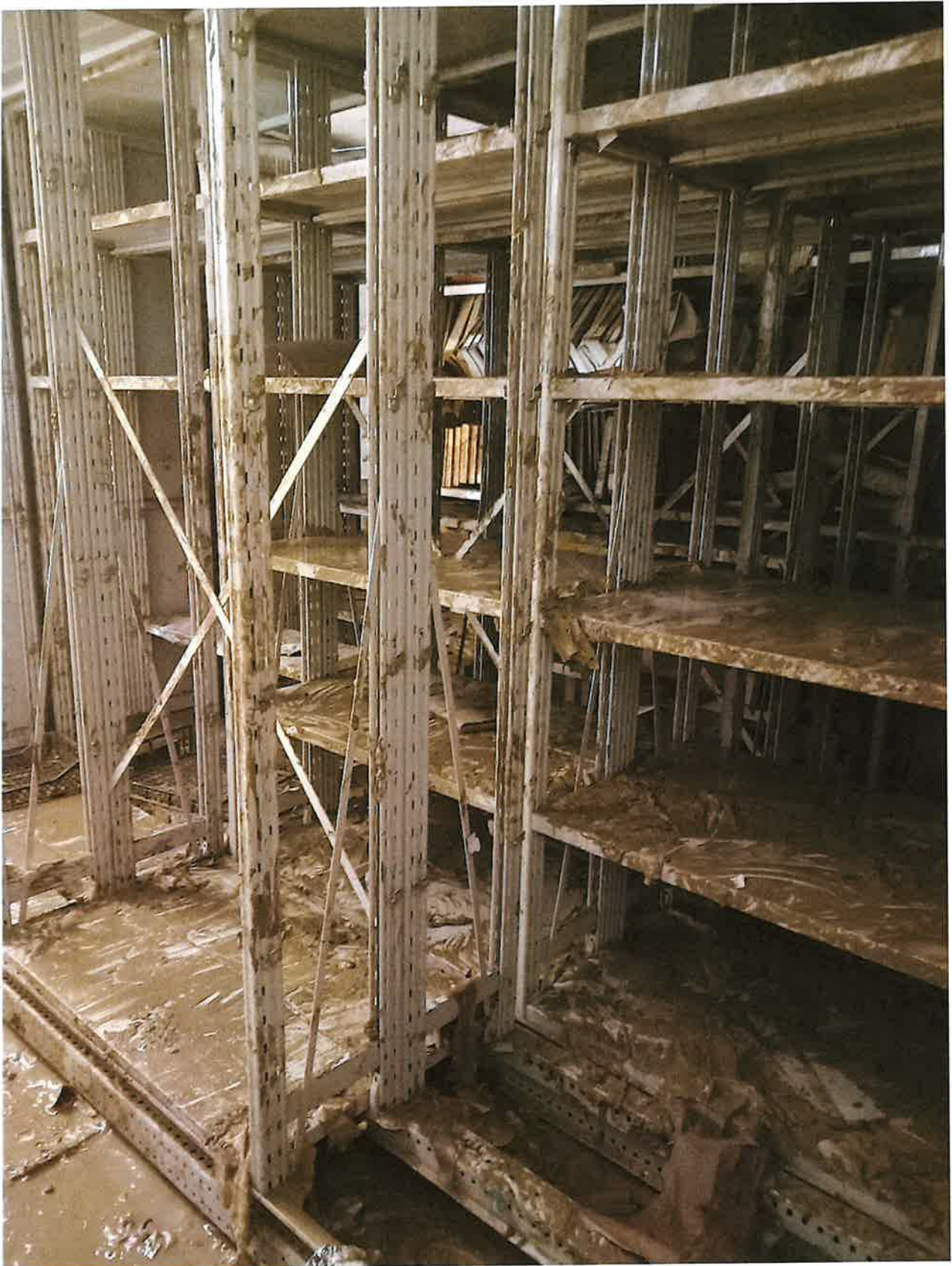
Fig. 18: dettaglio compact Archivio Storico smontati a fine giornata. 9/11/2023