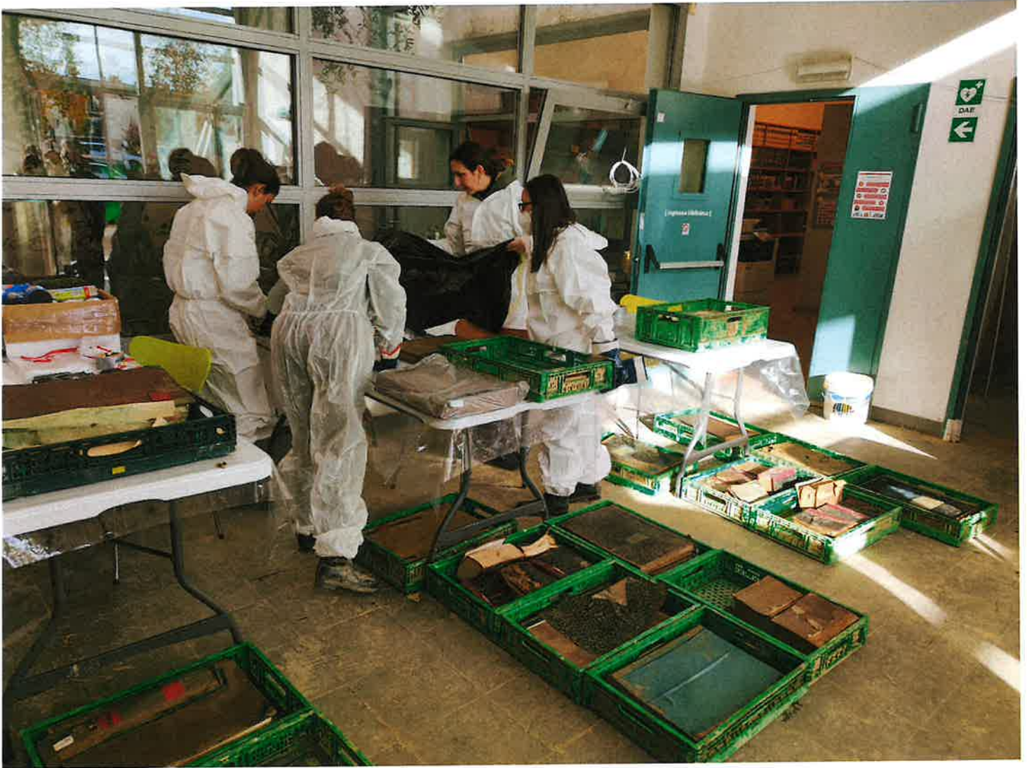
Fig. 5: ingresso biblioteca, recupero documenti storici. 8/11/2023