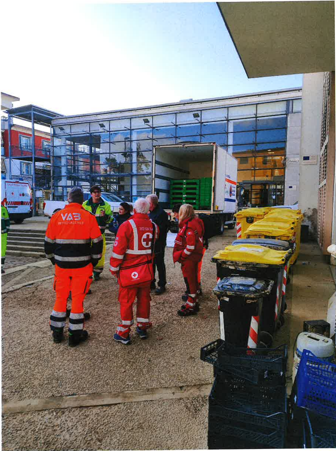
Fig. 2: preparazione esterna mattina 8/11/2023