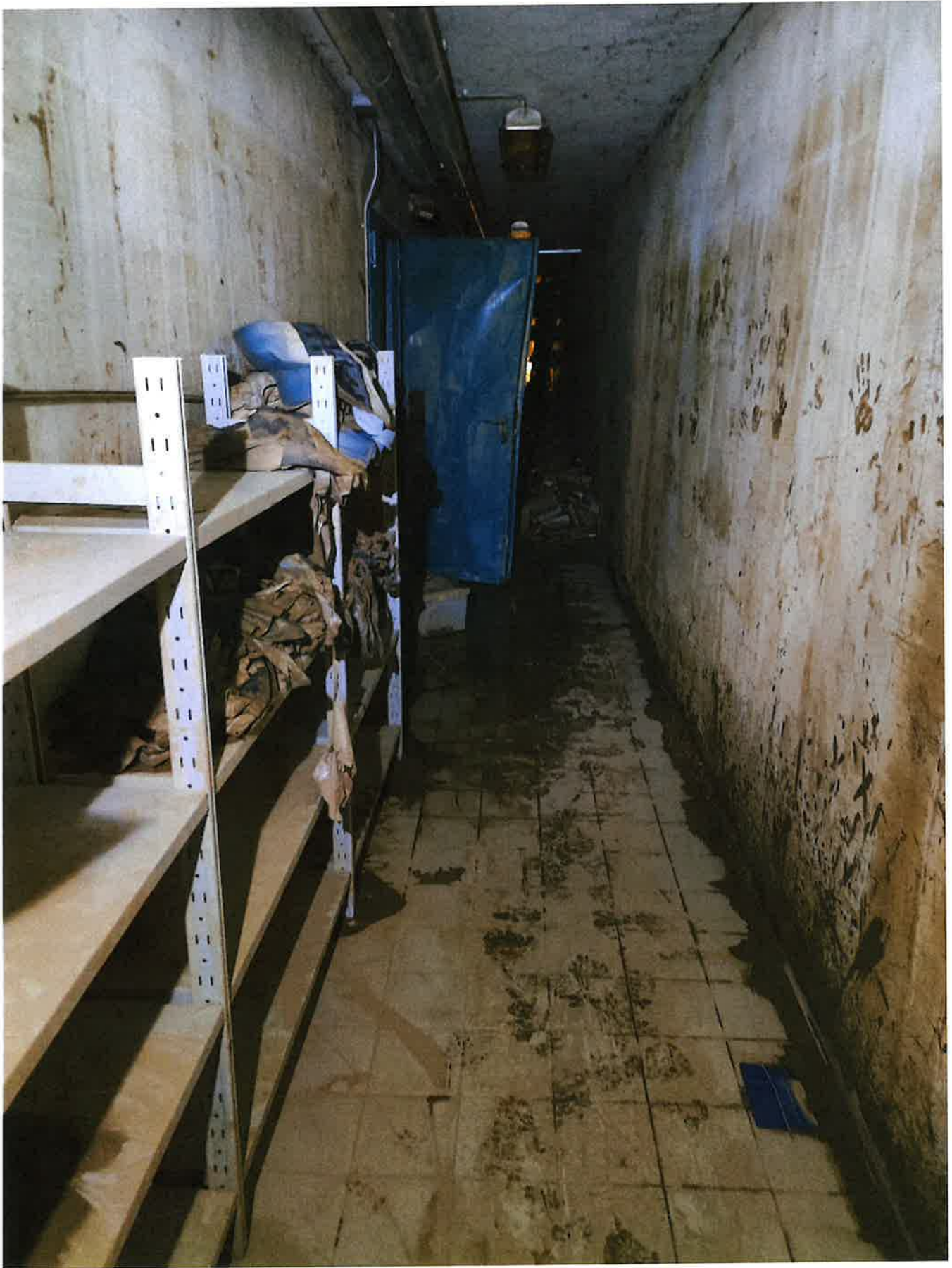
Fig. 20: dettaglio corridoio e porta stanza 2. Sera 9/11/2023