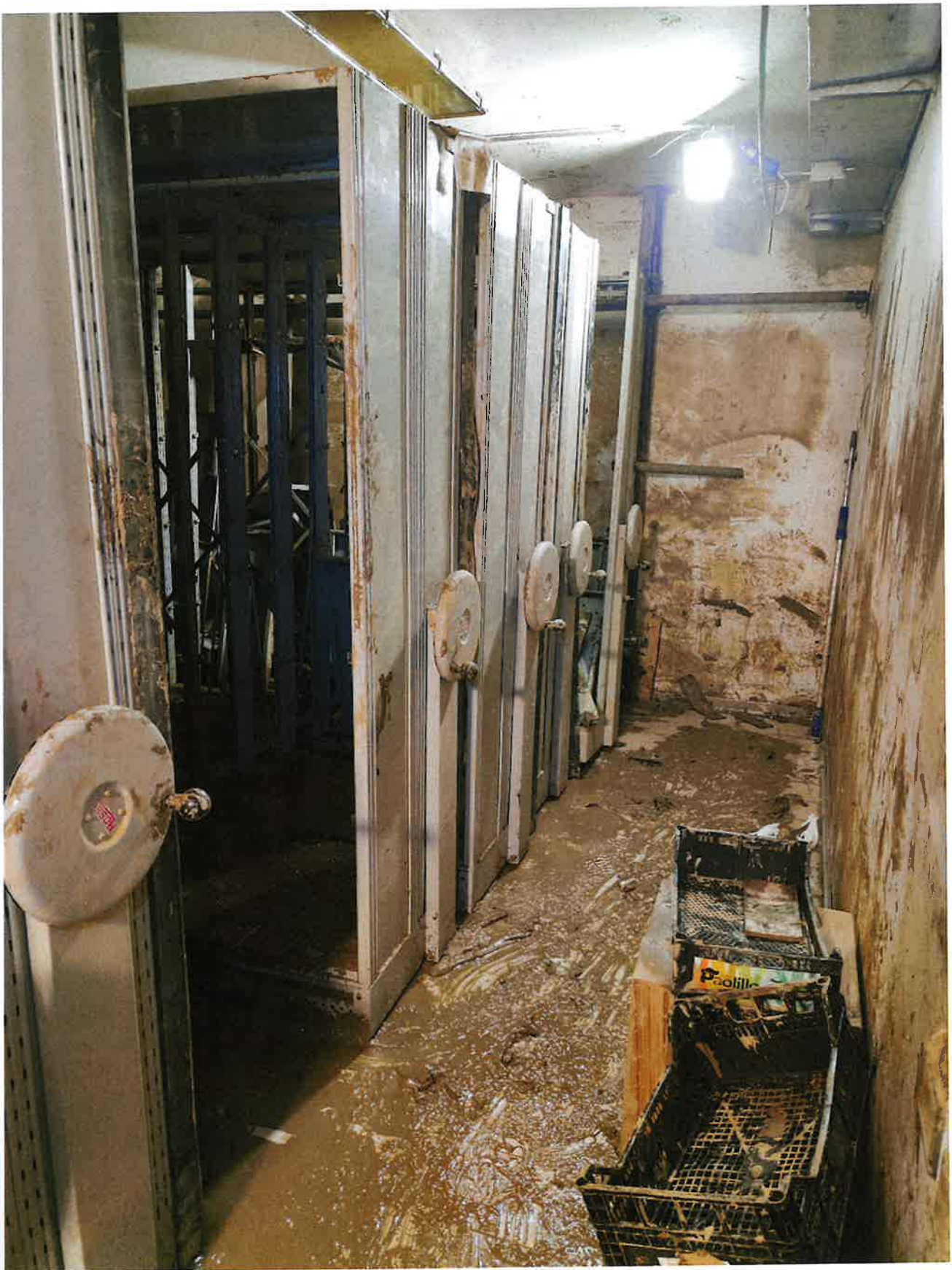
Fig. 19: dettaglio Archivio Storico a fine giornata. 9/11/2023