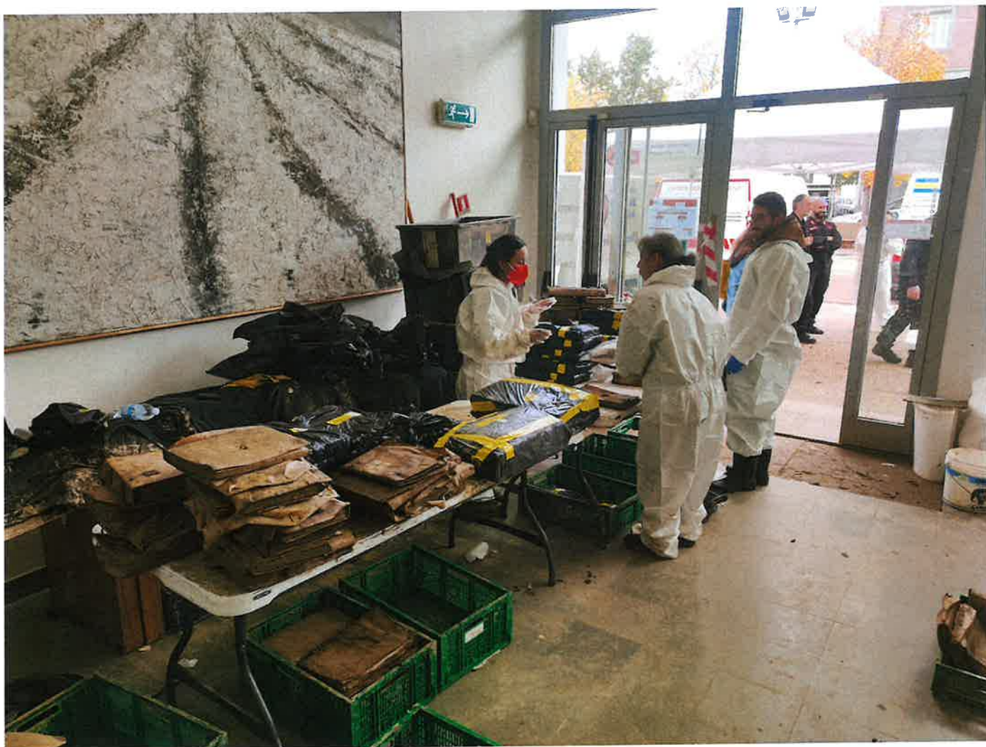
Fig. 10: Soprintendenza al lavoro. 9/11/2023